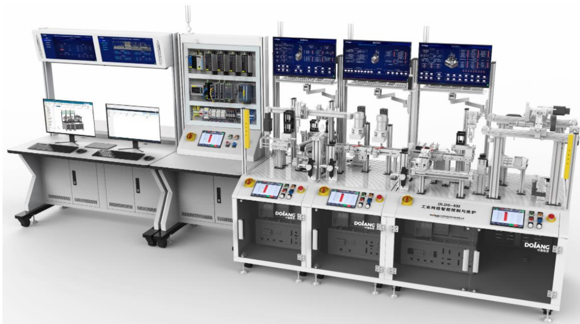
图 2 DLDS-532 工业网络智能控制与维护系统

通信协议，可将传感器数据与外部控制数据实现实时通信；支持与 PLC、单片机、机器人控制器等多种真实控制设备的通信与联调。