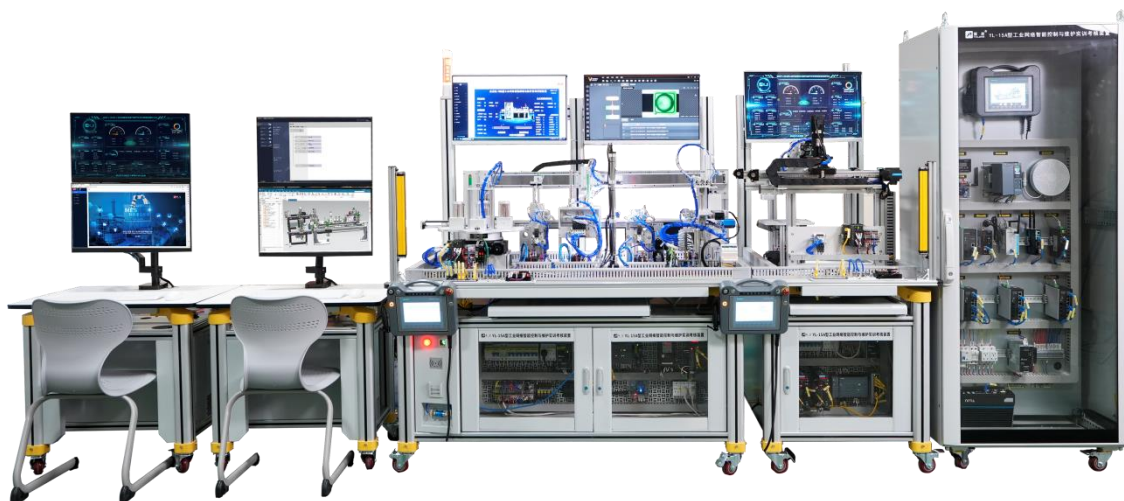
图3 YL-15A型工业网络智能控制与维护实训考核装置